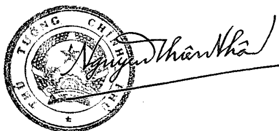
Nguyễn Thiện Nhân